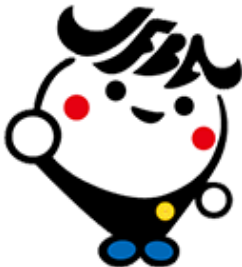
日弁連広報キャラクター ジャブバ