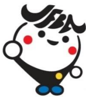
日弁連広報キャラクター ジャフバくん