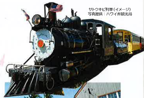
サトウキビ列車(イメージ)