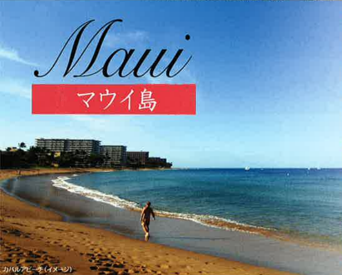
カハルアビーチ(イメージ)