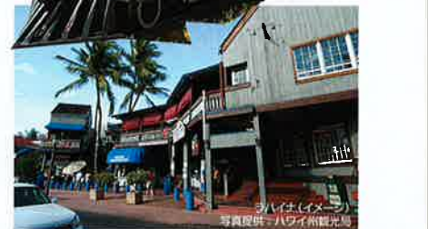
ラハイナ(イメージ)