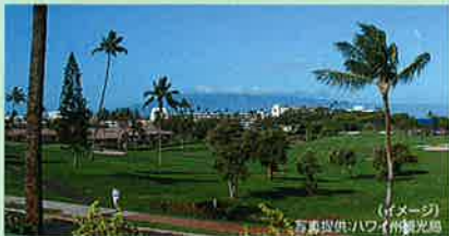
(イメージ)

ハワイ滞在中の楽しみの一つがゴルフ。息をのむような景観に包まれたホール、チャンピオンシップ級のコース設計。世界中のゴルファーがハワイに魅了されています。火山性のラフに並ぶグリーン、見事な海岸沿いのウォーターハザード、独特な地形のハワイ6島には、ここにしかないユニークなコースが広がっています。花々に彩られたすばらしいハワイのゴルフコースの数々で、ゴルフ天国ハワイをお楽しみ下さい。