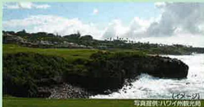
(イメージ)