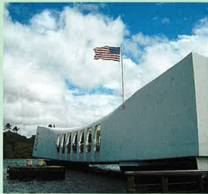
パールハーバー(イメージ)

ハワイアン・チョコレート作りを体験し、「この木なんの木」のコマーシャルで有名なモアナ・ガーデンへ向かいます。ジュラシックパーク、ゴジラ、パールハーバー等の映画撮影で名の通るクアロア牧場での映画村ツアーを楽しんだ後は、憧れのノースショアでフリータイム! ドール プランテーションやパールハーバーの見学も含まれる盛りだくさんのツアーです。