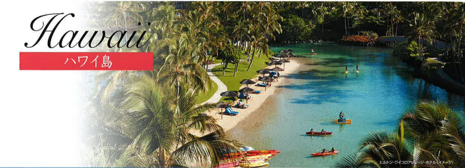
ヒルトン・ワイコロアビーチホテル(イメージ)