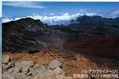
ハレアカラ(イメージ)