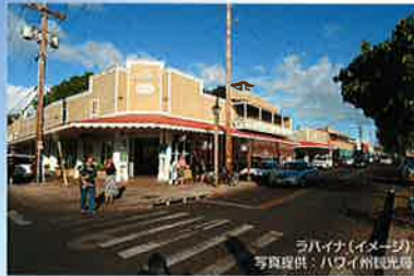
ラハイナ(イメージ)