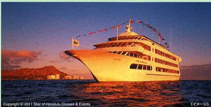
Copyright © 2011 Star of Honolulu Cruises & Events (イメージ)

夕日に染まるダイヤモンドヘッドやワイキキを眺めながらステーキとロブスターの夕食を楽しんだ後は、エンターテインメントとショーに乗客全員で参加します。にぎやかで楽しい「3スター」をご堪能ください。